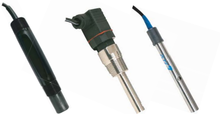
[ 4-cell : DDG472 / SDDG472 ]